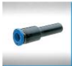
Steckverbindung mit Stecknippel, reduzierend