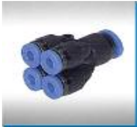
Mehrfachverteiler mit 4 red. Abgänge