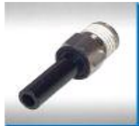
Steckanschluß-Einschraubtülle zur Kombination