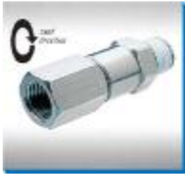
Drehverschraubung mit 2 Kugellagern