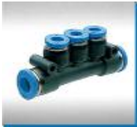
T-Mehrfachverteiler, 3 red. Abgänge