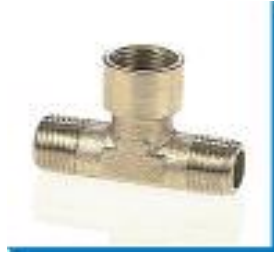
T-Aufschraubverbinder, kegelig, Messing vernickelt