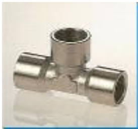
T-Verbinder, Messing vernickelt