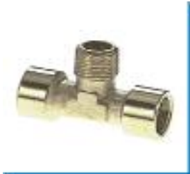
T-Einschraub-Verbinder, kegelig, Messing vernickelt