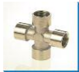
Kreuz-Verbinder, Messing vernickelt