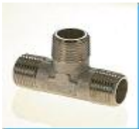
T-Verbinder, kegelig, Messing vernickelt