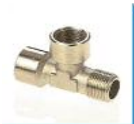
L-Einschraub-Verbinder, kegelig, Messing vernickelt